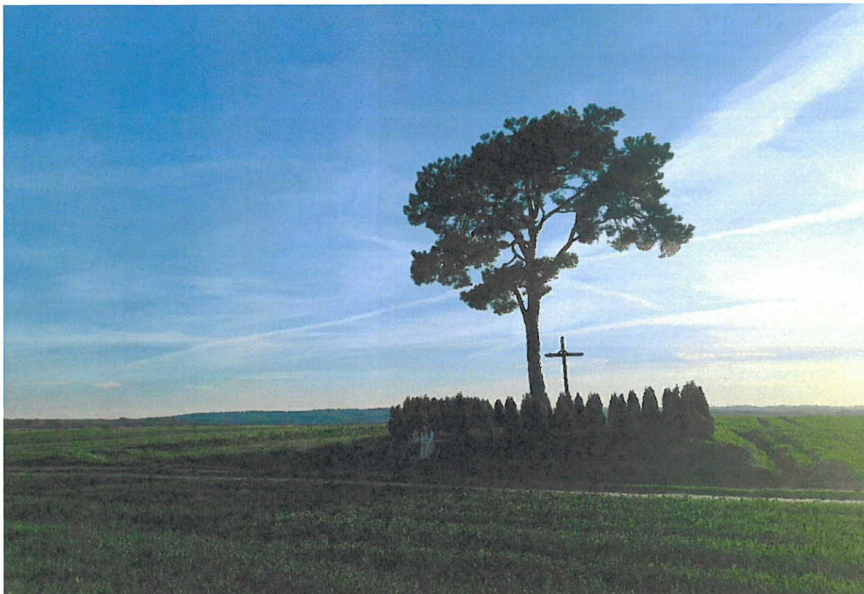
Cmentarz Choleryczny w Więckowicach