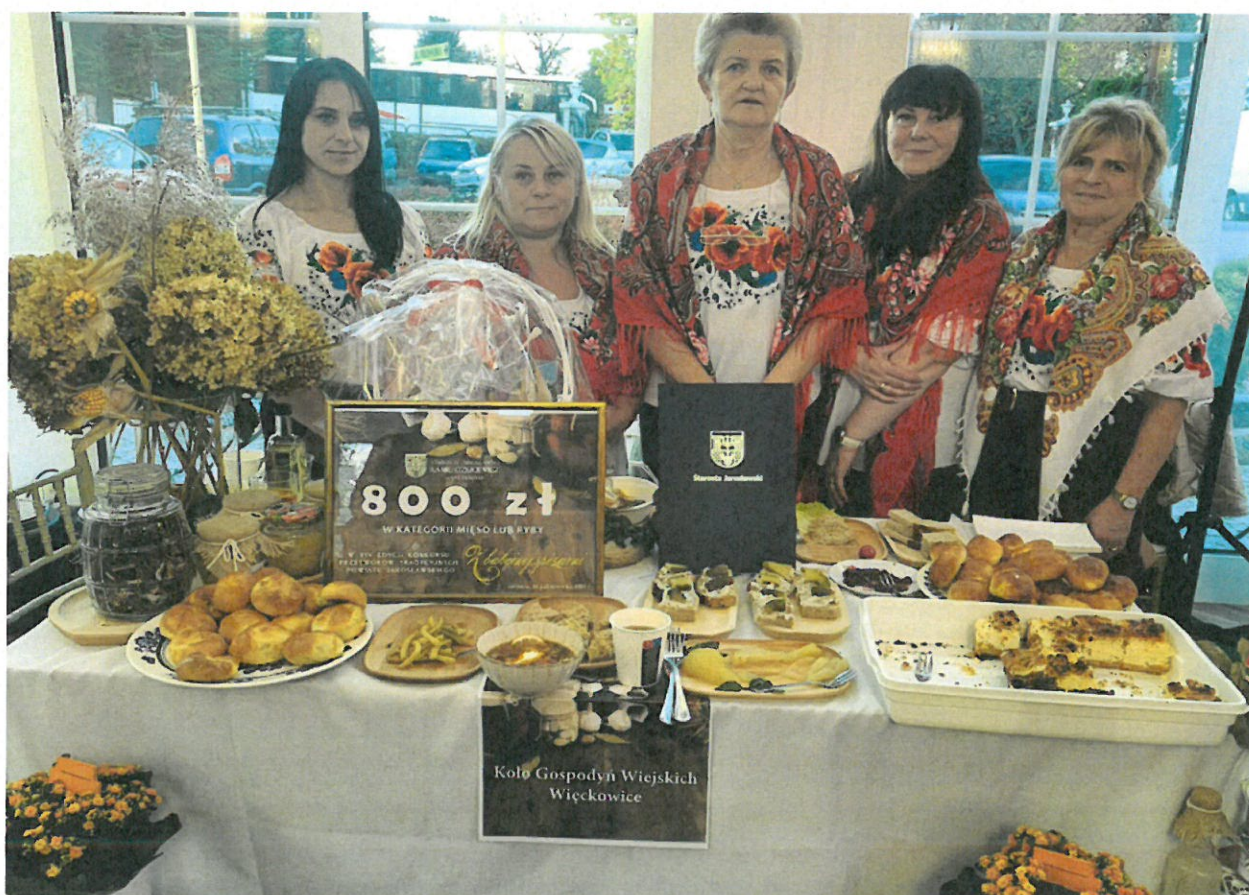
Członkinie KGW w Więckowicach