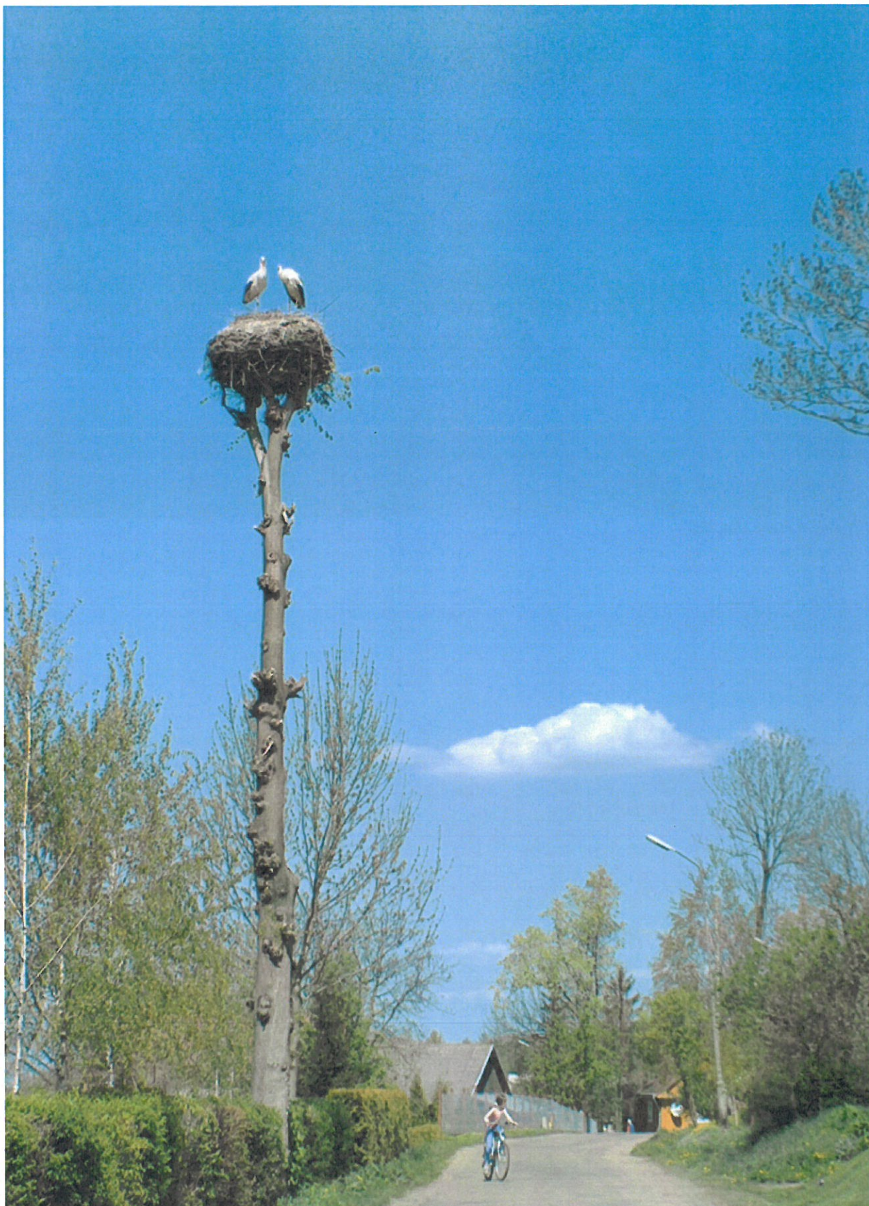
Przyrodnicze walory Więckowic