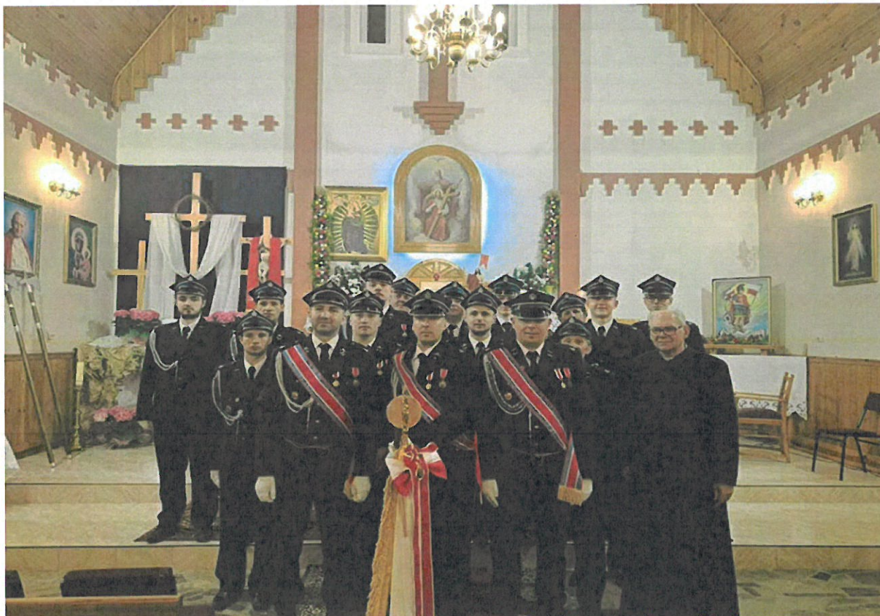
Członkowie OSP Więckowice