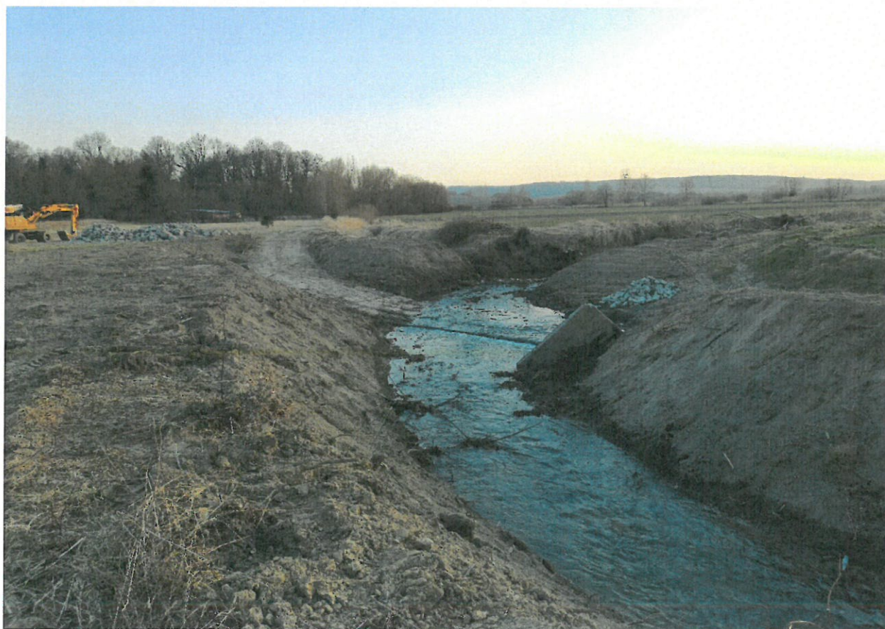
Fragmenty rzeki Mleczki