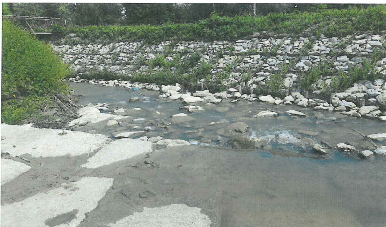
Fragment rzeki Mleczki