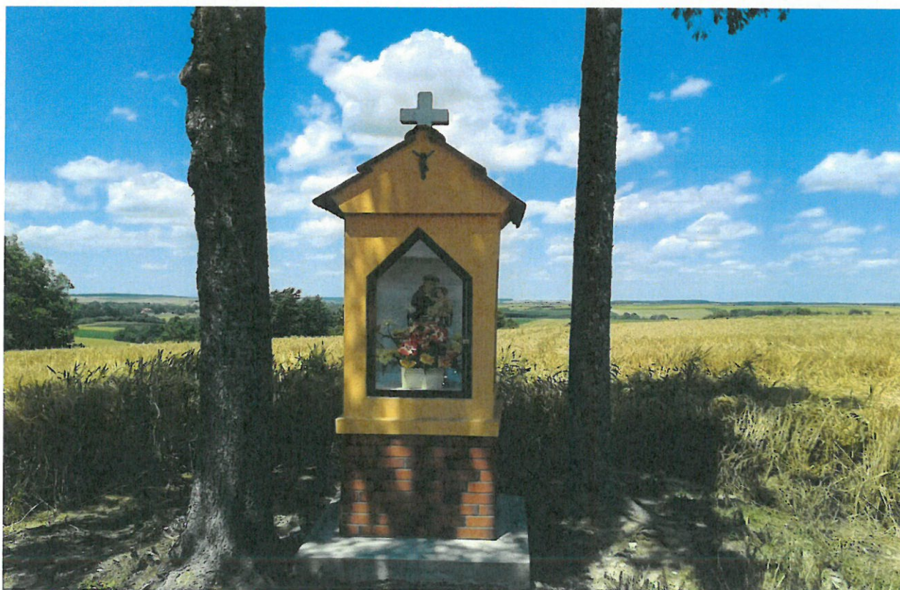
Kapliczka przydrożna / św. Antoni