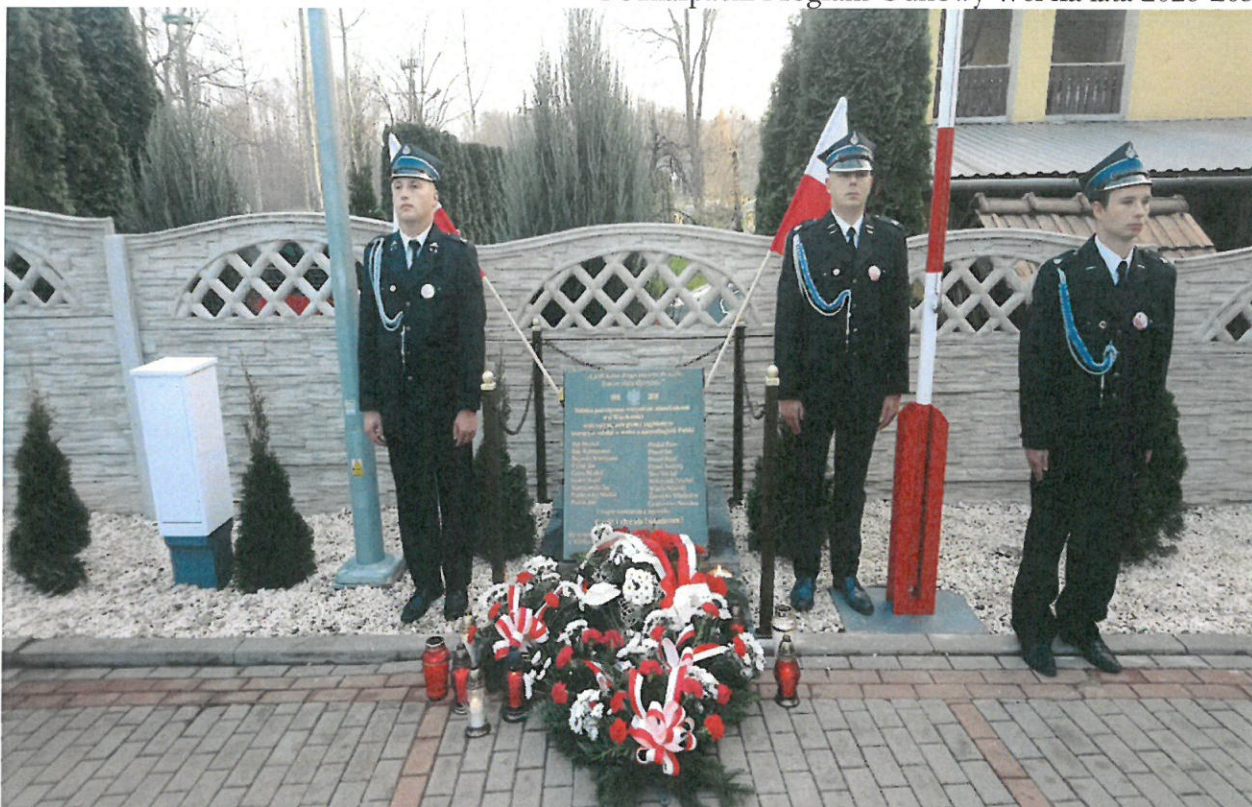
Uroczystość upamiętniająca. Straż honorowa OSP Więckowice.