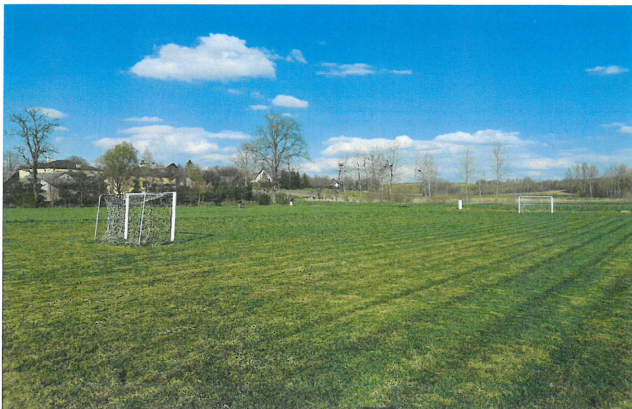
Boisko sportowe w Więckowicach