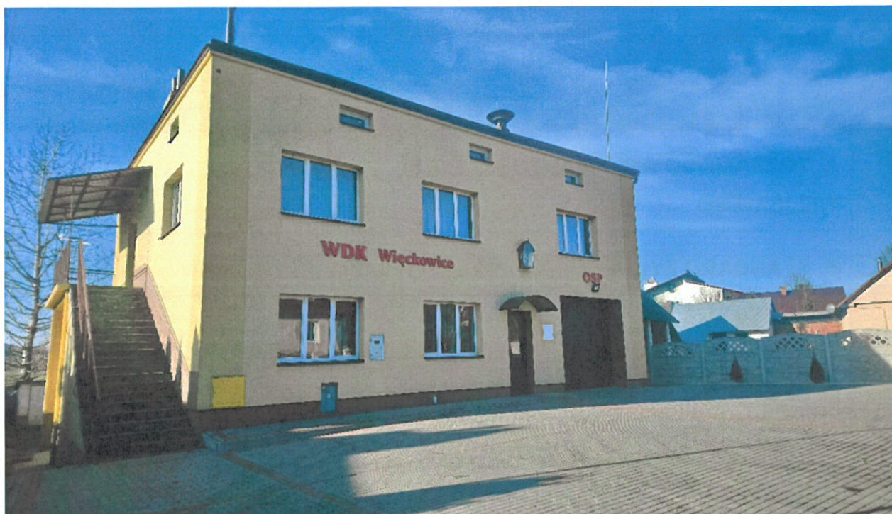
Świetlica Wiejska wraz z Remizą OSP w Więckowicach