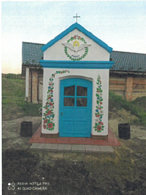
Kapliczka Matki Bożej Bolesnej. Wjazd do Więckowic.