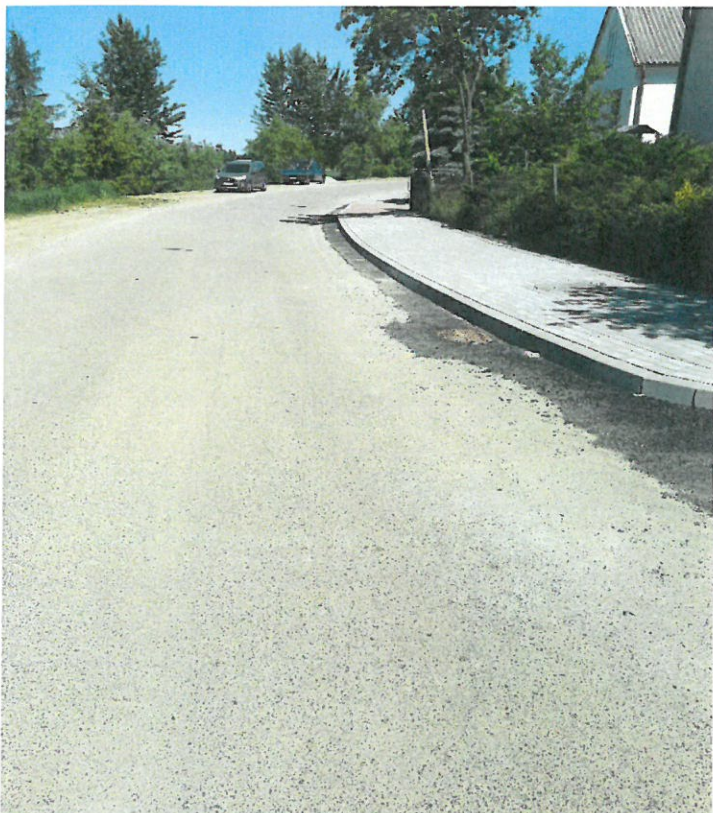
Chodnik wykonany w 2024 roku -150m