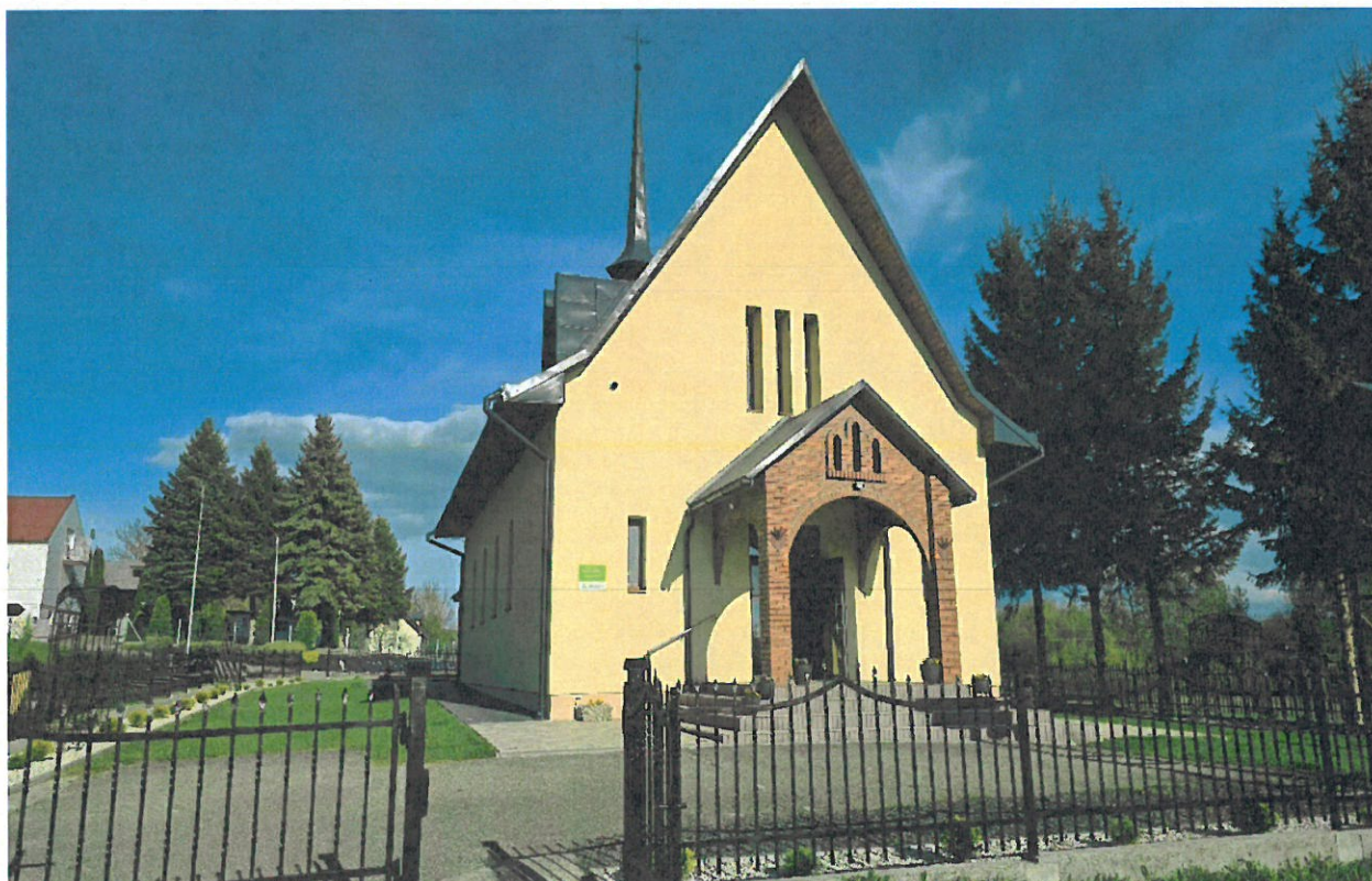
Kościół rzymskokatolicki pod wezwanie Trójcy Świętej w Więckowicach